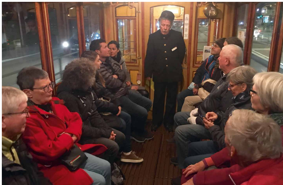
Vorstand und Programmgruppe auf dem Ausflug mit den „Lisbethli“ im November 2021.