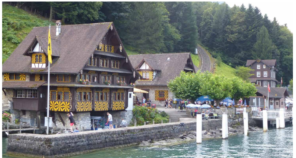
Frühlingswanderung Treib UR – Seelisberg am 17. Juni 2022