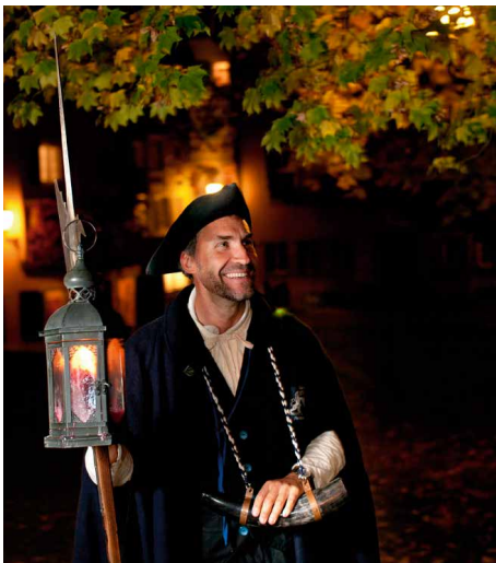
Nachtwächterführung am 18. Mai 2022