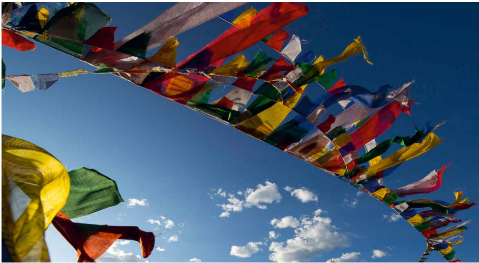
Bilderreise: Mit dem Dalai Lama durch den Himalaya am 4. Mai 2022