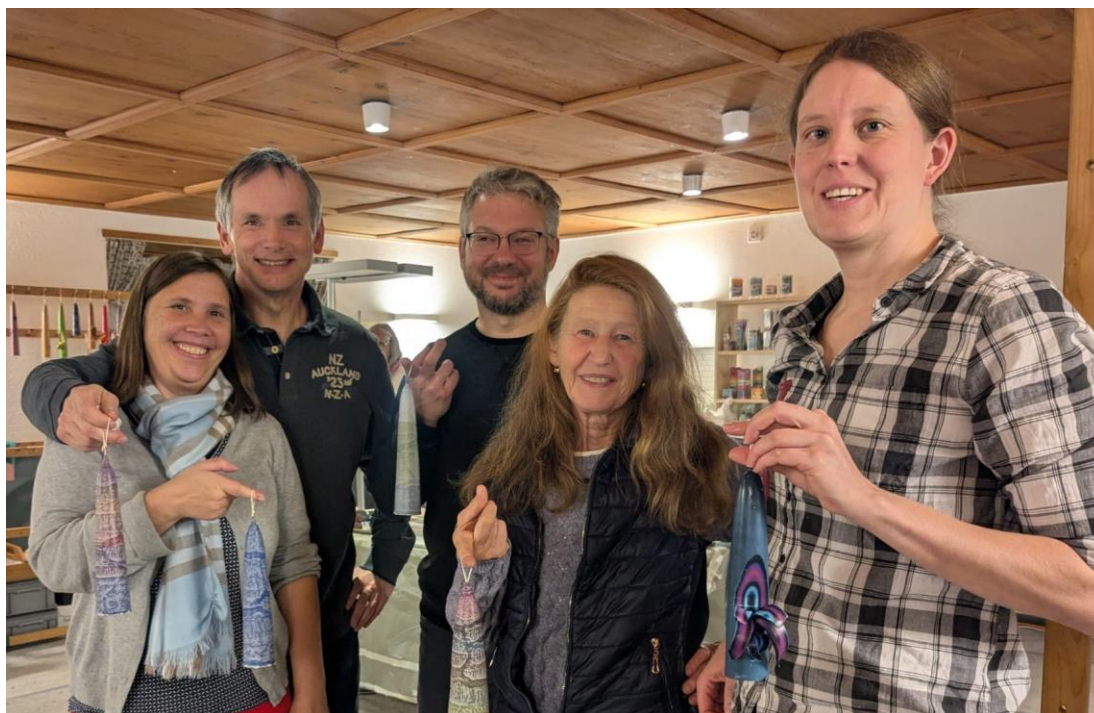
Der Vorstand im November 2025 zu Besuch bei der IG Kerzenziehen.

Alle unsere Angebote finden Sie jederzeit im Internet auf www.vivat-schlieren.ch