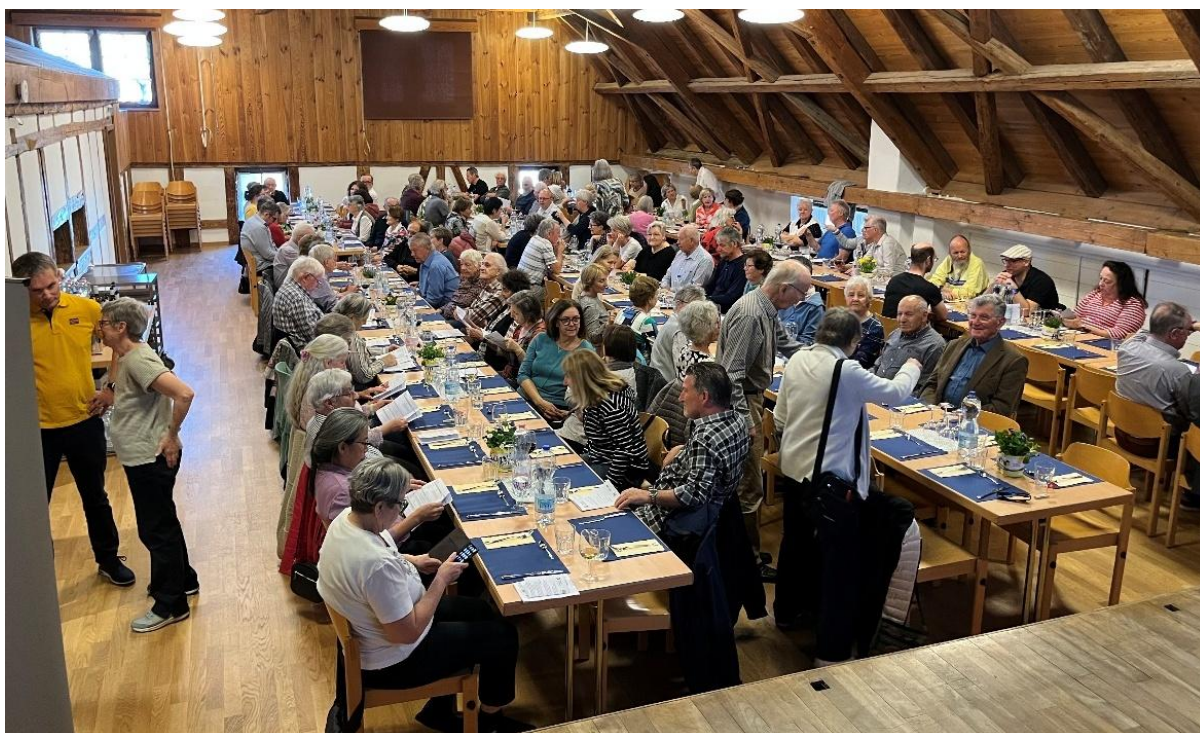
Gemütliches Beisammensein an der GV 2025